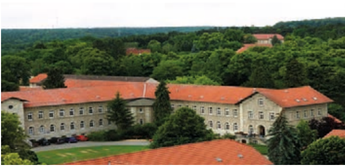
AWO Psychiatriezentrum, Klinik C