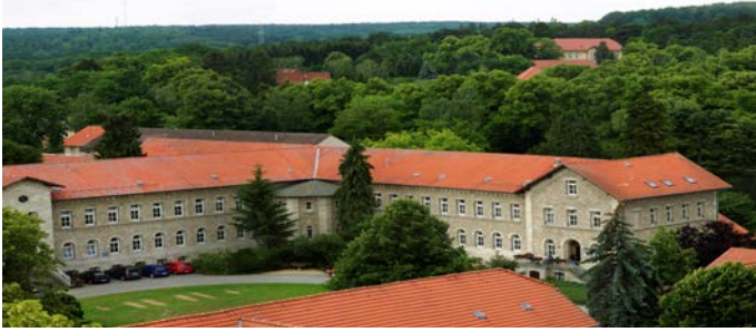
AWO Psychiatriezentrum, Klinik C